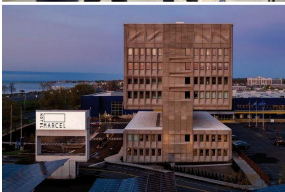
Oben: Passivhaus-Neubau des kommunalen Bauträgers Neue Heimat Tirol mit über 150 Wohnungen und Kita in Innsbruck. © PHI Mitte: Abendveranstaltung bei der 27. Internationalen Passivhaustagung. © PHI Unten: Das markante, frühere Bürogebäude aus den 1960-er Jahren in Connecticut, USA, ist nach der Sanierung ein klimafreundliches Hotel. © Seamus Payne Hobhouse