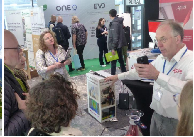
Am Veranstaltungsort hatten die Teilnehmenden einen guten Blick auf das Bergpanorama Innsbrucks (links). Bei der Passivhaus-Fachausstellung präsentierten die Firmen ihre Komponenten für hoch energieeffizientes Bauen und Sanieren einem internationalen Fachpublikum aus 42 Ländern.