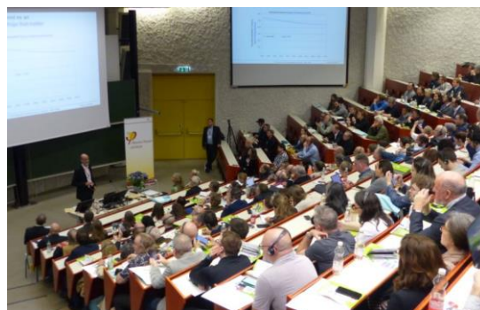
Die 27. Internationale Passivhaustagung fand auf dem Campus Technik der Universität Innsbruck statt. Zur Eröffnung ging es in den großen Hörsaal.