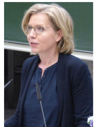
Österreichs Klimaschutzministerin Leonore Gewessler auf der Internationalen Passivhaustagung.

Dass Innsbruck aufgrund seiner alpinen Lage bereits die Temperaturerwärmung von zwei Grad erreicht habe, schilderte Bürgermeister Georg Willi. Die Stadt habe früh damit begonnen, hoch energieeffizient zu bauen und verzeichne daher eine hohe Dichte an Gebäuden im Passivhaus-Standard. Wichtig dafür sei ein starker kommunaler Wohnbau.