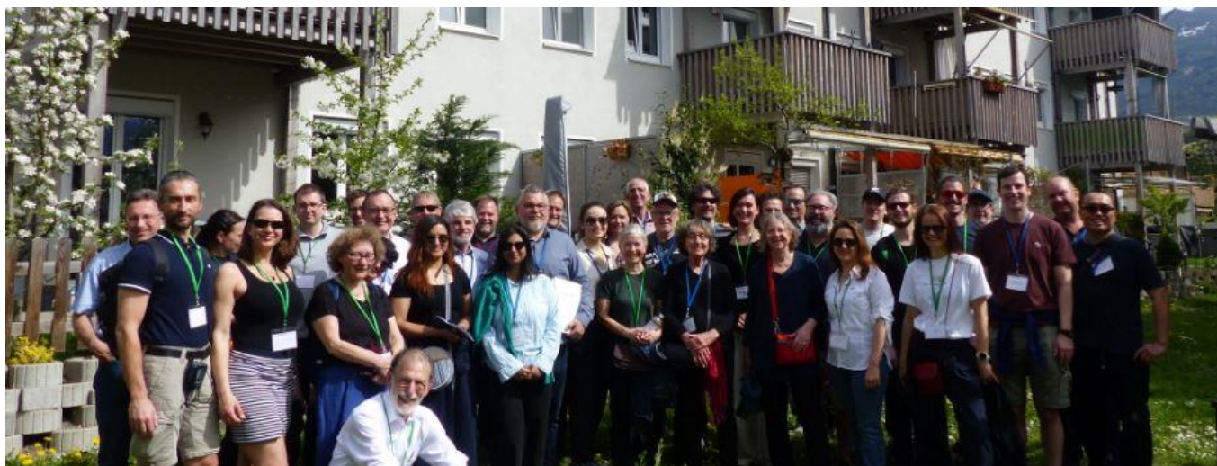
Gruppenbild vor erfolgreichem SINFONIA-Sanierungsprojekt in Innsbruck: Die 27. Internationale Passivhaustagung bot vier Exkursionen, um hoch energieeffiziente Projekte in Neubau und Sanierung ausführlich anzuschauen.