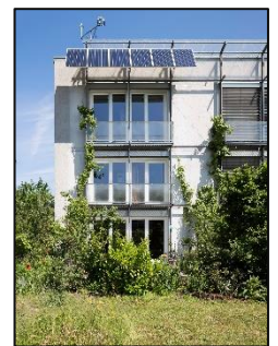
Das weltweit erste Passivhaus in Darmstadt feiert 2021 seinen 30. Geburtstag!

Mail: presse@passiv.de / Tel: 06151 / 826 99-25