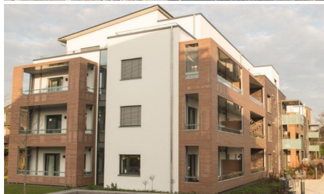
Projekte der #25intPHC: Studentenwohnheim in Wien (oben) und Klimaschutzsiedlung in Kleve: Gebäude im Passivhaus-Standard, die nur äußerst wenig Energie zum Heizen und Kühlen benötigen, sind längst weit verbreitet. © G. Reinberg / Reppco Architekten