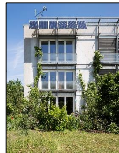
Das weltweit erste Passivhaus in Darmstadt-Kranichstein.