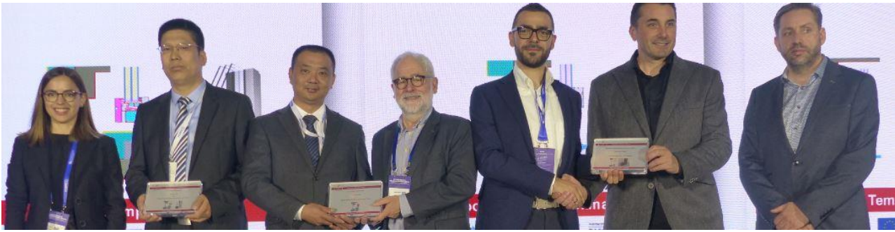
Am Component Award 2019 zu „Windows for the future“ nahmen 23 Unternehmen aus 12 Ländern teil. Die insgesamt 14 Preisträger sind auf der Internetseite des Passivhaus Instituts im Einzelnen genannt.