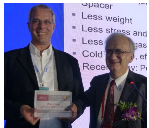
Vier Unternehmen erhielten in Gaobeidian den Innovation Award 2019.

Zahlreiche Hersteller von Passivhaus-Komponenten erhielten in Gaobeidian ein Zertifikat für ihr Produkt, darunter viele chinesische Hersteller. Zudem zeichnete das Passivhaus Institut die Preisträger des Komponentenpreises sowie des Innovationspreises aus. Der Innovation Award ging an das Unter-