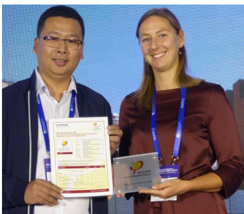
Auch Zertifikate für Passivhäuser überreichte das Passivhaus Institut bei der Tagung.