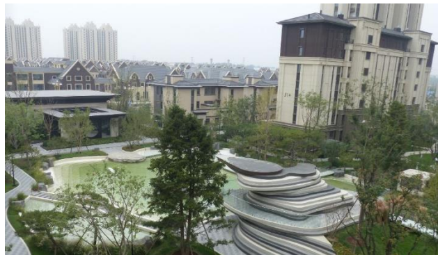
Das Passivhaus Institut und die internationale Netzwerkorganisation iPHA präsentierten sich ebenfalls auf der Fachausstellung in Gaobeidian (l.). Exkursion in die Passivhaus-Siedlung Bahnstadt Gaobeidian (r.).