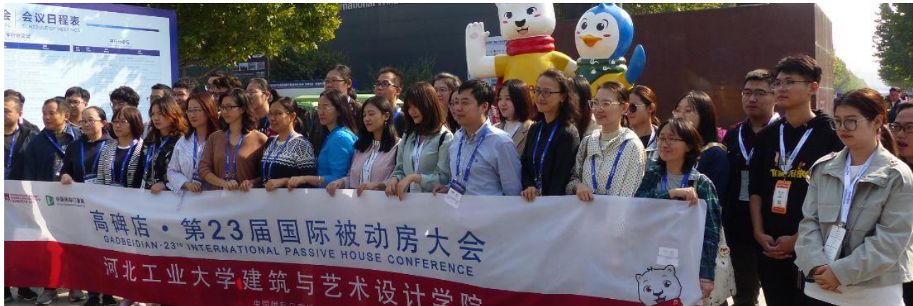
Zu der ersten Internationalen Passivhaustagung in Gaobeidian, China, wo auch die weltweit größte Passivhaus-Siedlung entsteht, kamen viele internationale Teilnehmer sowie viele Besucher aus China selbst.